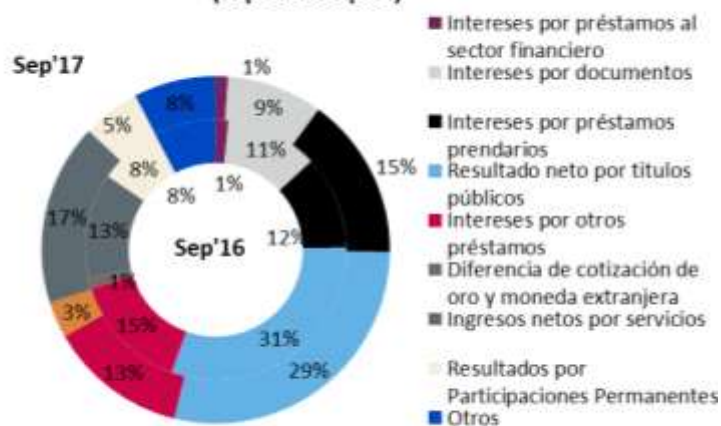
Gráfico #1: Desagregación de ingresos (Sep'17 vs Sep'16)